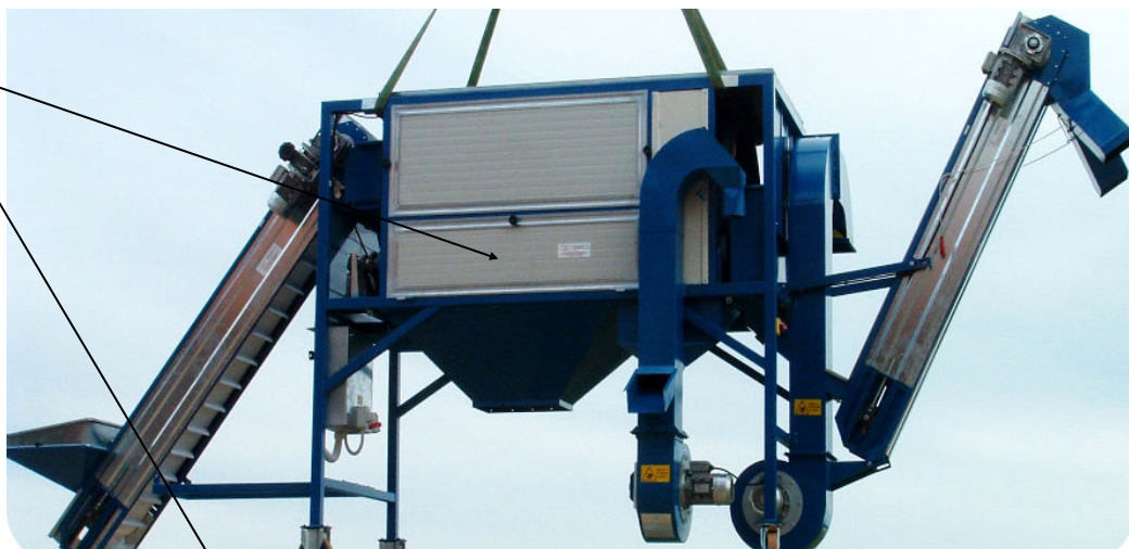
Particolare trasmissione / Particular transmission

Right and below Application examples air cleaners on machinery complex