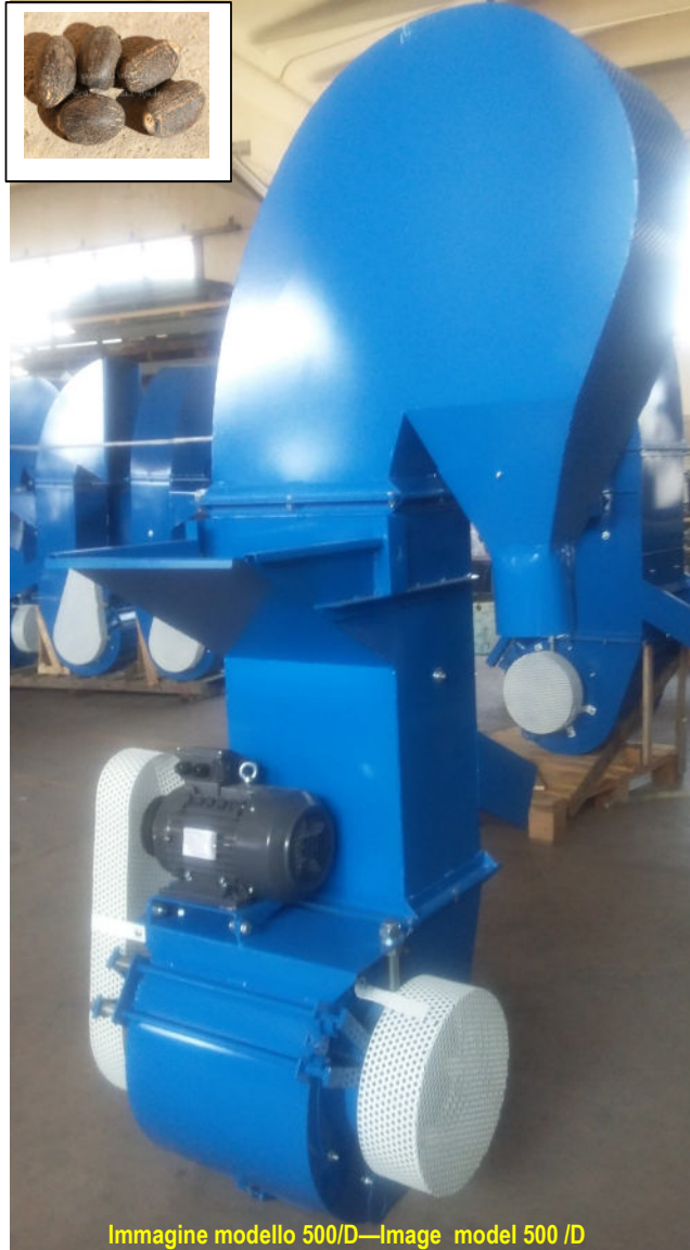
Immagine modello 500/D—Image model 500 /D