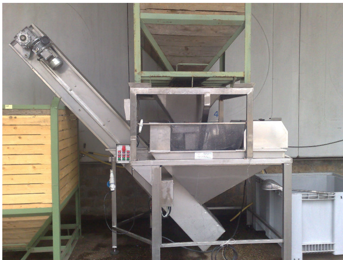
Nell'immagine : Schiumarola versione "M"

Zona Ind. Loc. Capannelle - 01030 Carbognano (VT) Part. IVA e Codice Fiscale: 01955020563