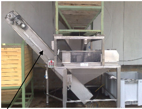
Nastro elevatore Tramoggia carico